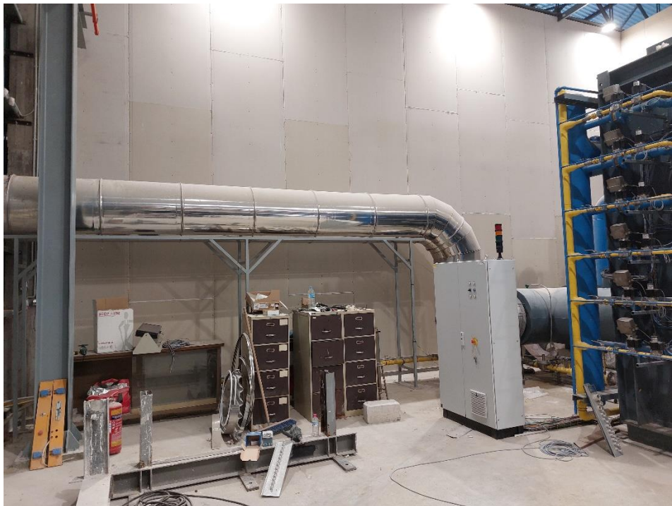
Φωτογραφία 1. Απεικόνιση του υπάρχοντος συστήματος απαγωγής καυσαερίων στο οποίο θα πρέπει να πραγματοποιηθεί η προσαρμογή του συστήματος του νέου κλιβάνου.